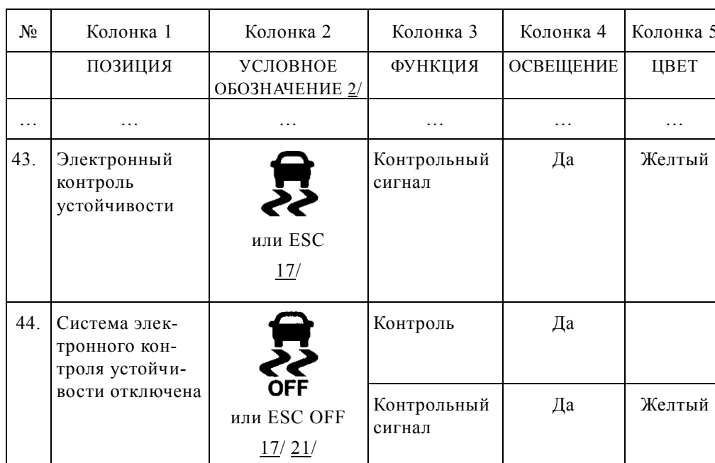
Таблица 1, изменить следующим образом (включив новую сноску 21/):